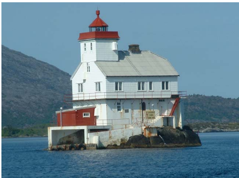
Stabben Fyr ved Florø.